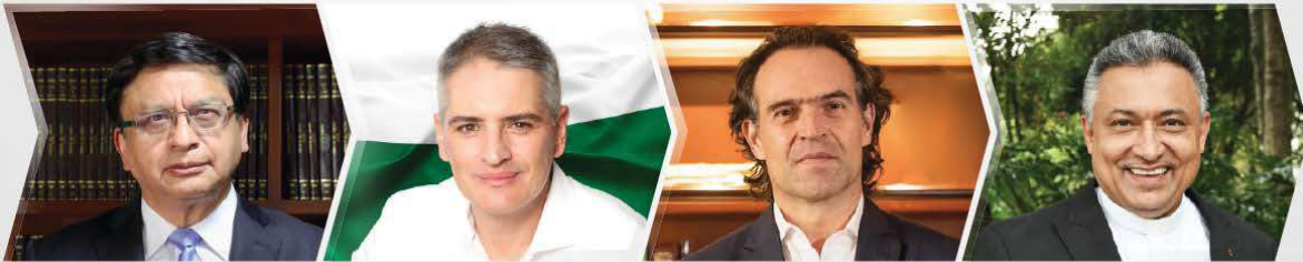
Jorge Enrique Ibáñez Najjar Presidente de la Corte Constitucional